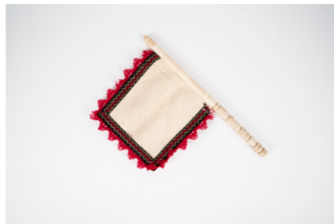
G015 / Eventail 19 x 19 cm Fibre de palmier, bois et fil de laine