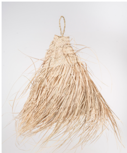
G032 / Suspension Hauteur 30 cm Fibre de palmier