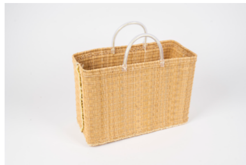
G006 / Couffin Hauteur 25 cm - Largeur 16 cm - Longueur 35 cm Fibre de palmier