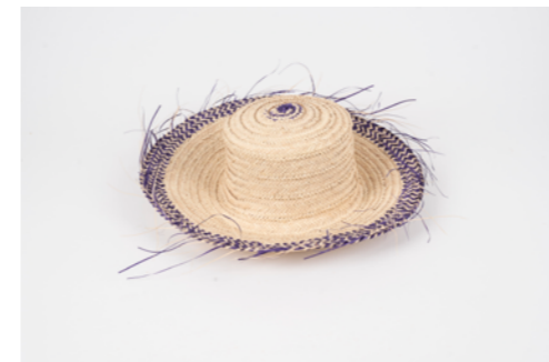
G001 / Chapeau Tour de tête 58 cm - Diamètre 37 cm Fibre de palmier