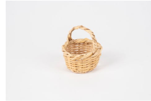
G030 / Panier Hauteur 7 cm - Diamètre 11 cm Roseaux