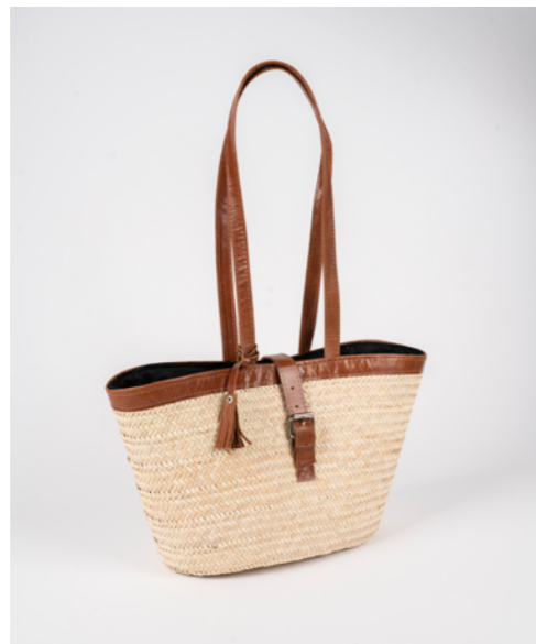
G019 / Couffin