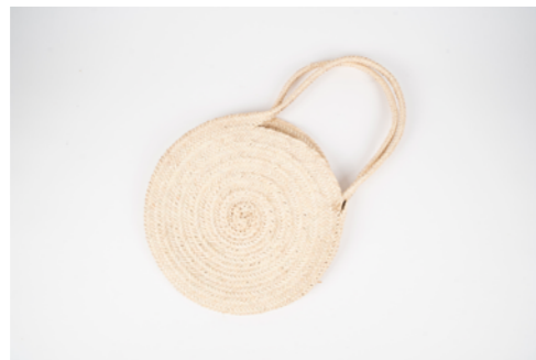
G023 / Sac