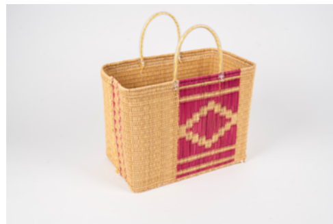
G025 / Couffin

Hauteur 28 cm - Largeur 38 cm - Longueur 18 cm Fibre de palmier