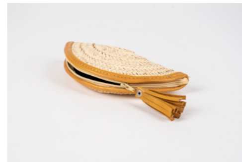
G016 / Pochette 9 x 20 cm Fibre de palmier et cuir