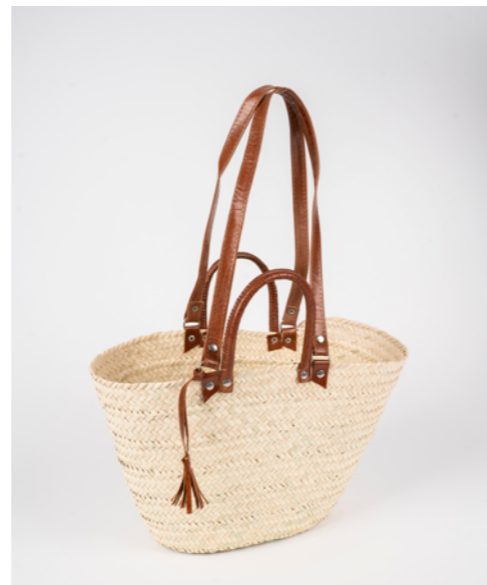
G020 / Couffin