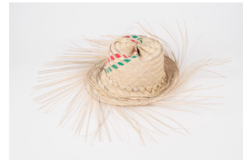
G001 / Chapeau Tour de tête 57 cm - Diamètre 30 cm Fibre de palmier