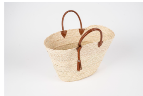
G010 / Couffin Hauteur 25 cm Fibre de palmier et cuir