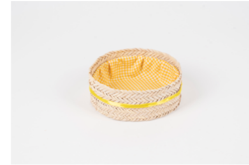
G031 / Panier Diamètre 13 cm Fibre de palmier et tissu