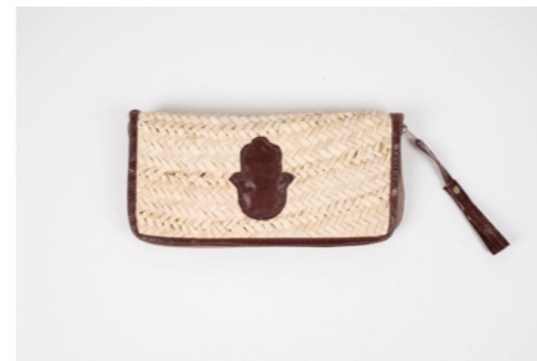
G018 / Pochette 13 x 26 cm Fibre de palmier et cuir