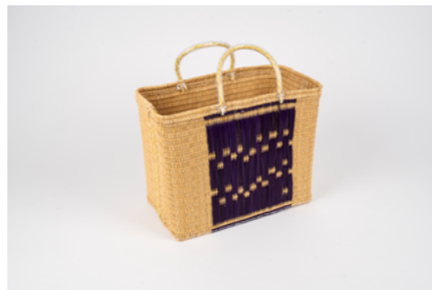
G024 / Couffin

Hauteur 28 cm - Largeur 38 cm - Longueur 18 cm Fibre de palmier