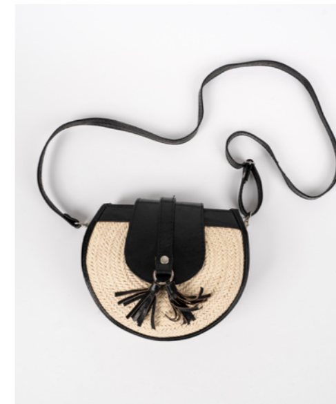
G022 / Sac