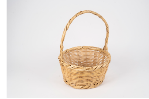
G029 / Panier Hauteur 13 cm - Diamètre 30 cm Roseaux