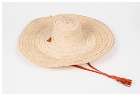
G005 / Chapeau Diam. 55 cm Fibre de palmier