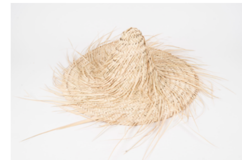
G003 / Chapeau conique Diam. 50 cm Fibre de palmier