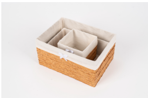
G033 / Paniers Hauteur 12 cm - Largeur 24 cm - Longueur 17 cm