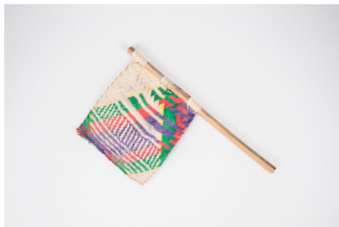
G014 / Eventail 19 x 19 cm Fibre de palmier et bois