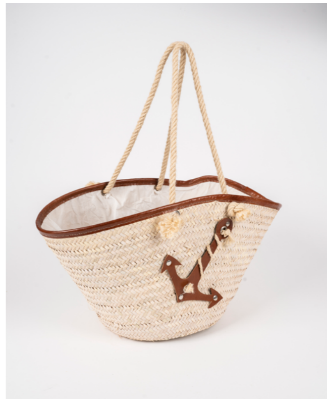
G027 / Couffin