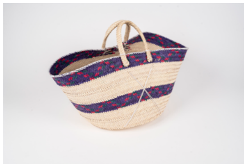
G012 / Couffin Hauteur 30 cm Fibre de palmier