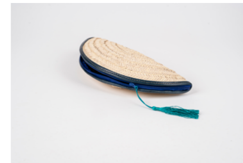
G017 / Pochette 14 x 29 cm Fibre de palmier et cuir