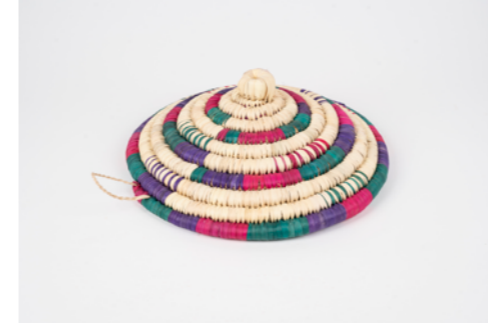
G028 / Couvercle Diam. 38 cm Fibre de palmier