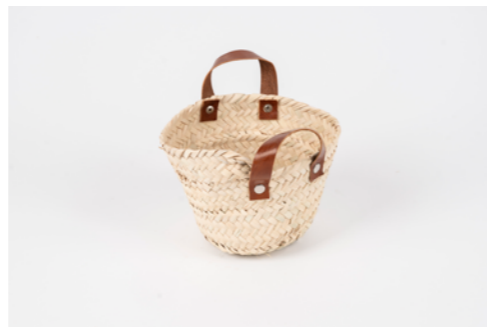
G026 / Petit couffin

Hauteur 28 cm - Largeur 38 cm - Longueur 18 cm Fibre de palmier