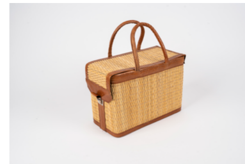
G009 Hauteur 22 cm - Largeur 14 cm - Longueur 30 cm Jonc et cuir