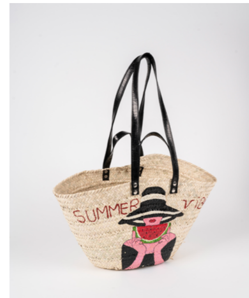
G021 / Couffin