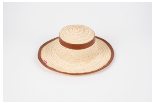
G004 / Chapeau Diam. 35 cm Fibre de palmier et cuir