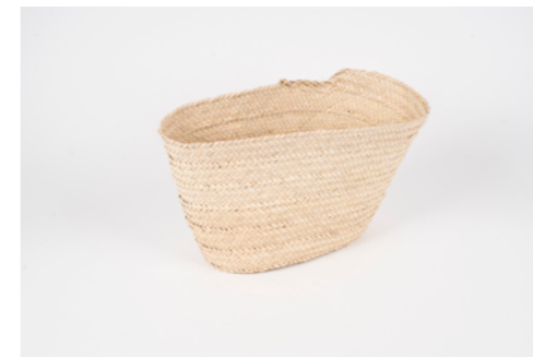
G011 / Couffin Hauteur 25 cm Fibre de palmier