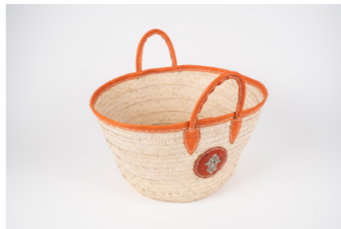
G007 / Couffin Hauteur 28 cm Fibre de palmier