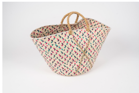
G013 / Couffin Hauteur 30 cm Fibre de palmier