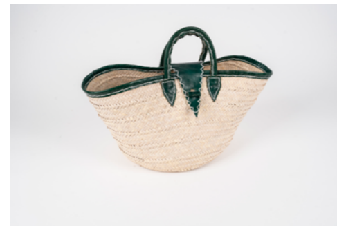
G008 / Couffin Hauteur 28 cm Fibre de palmier et cuir de chèvre