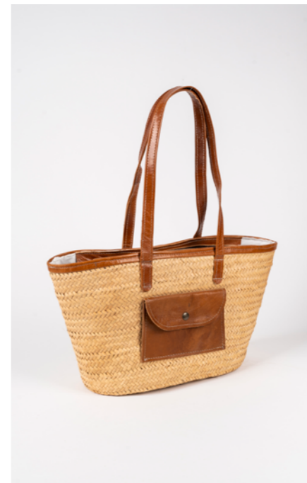
SP1 H. 25 cm L. 55 cm Sac couffin