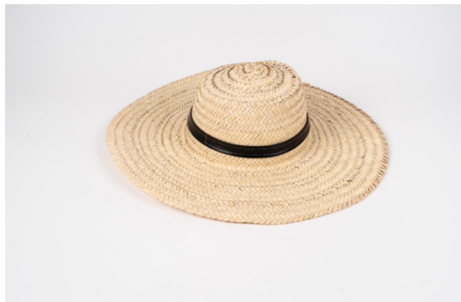
CH3 H. 10 cm L. 40 cm Chapeau