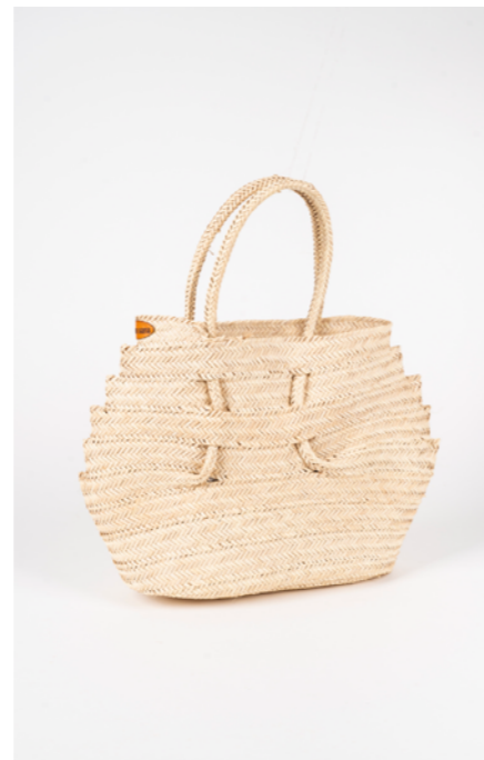
SA5 H. 30 cm L. 45 cm Sac couffin