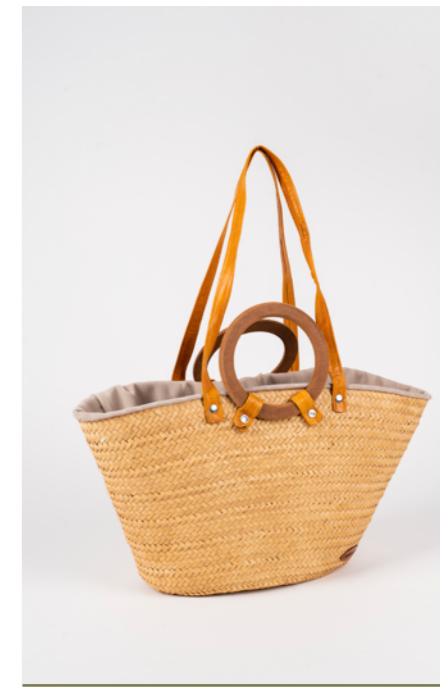
SA2 H. 25 cm L. 55 cm Sac couffin