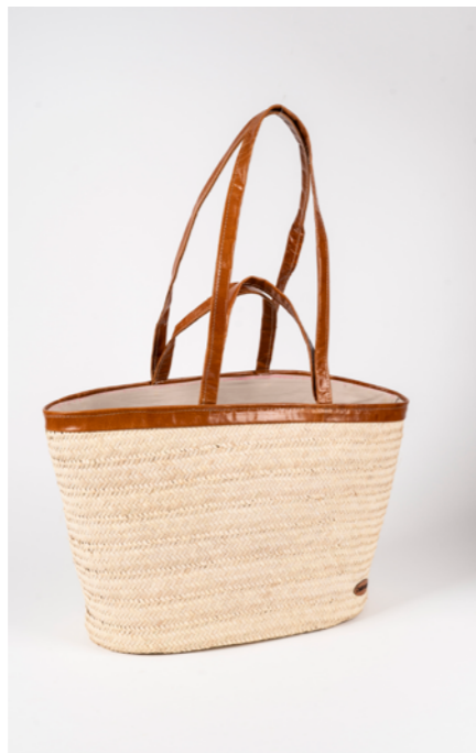
SA4 H. 30 cm L. 60 cm Sac couffin