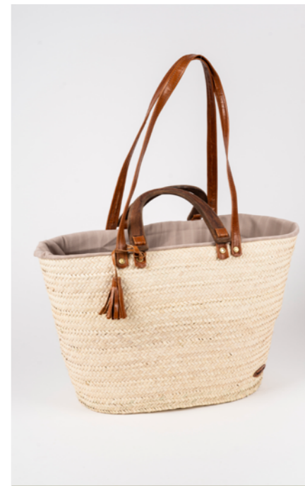
SA1 H. 30 cm L. 60 cm Sac couffin