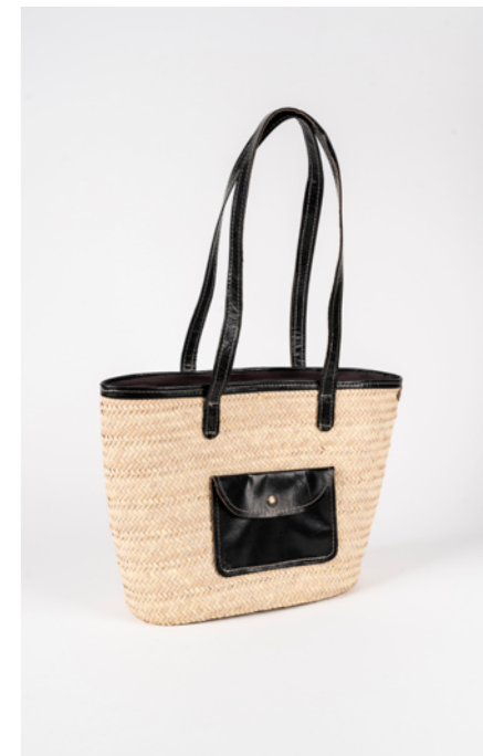
SP2 H. 25 cm L. 55 cm Sac couffin