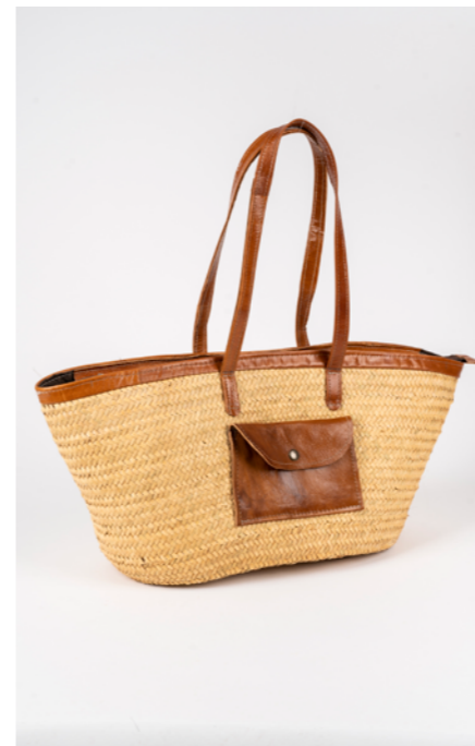
SP0 H. 30 cm L. 60 cm Sac couffin