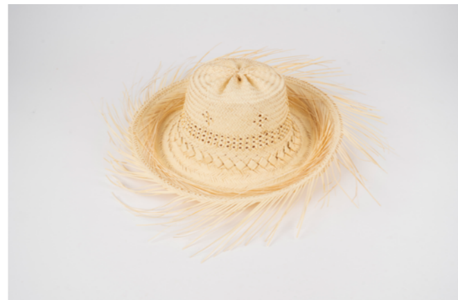
CH4 H. 10 cm L. 35 cm Chapeau