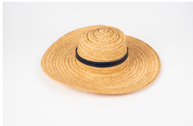
CH2 H. 10 cm L. 40 cm Chapeau