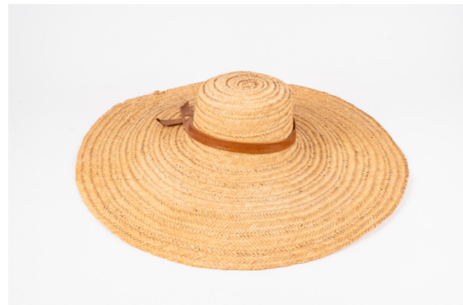
CHO H. 10 cm L. 55 cm Chapeau