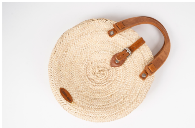
SCR Diam. 25 cm Sac couffin rond