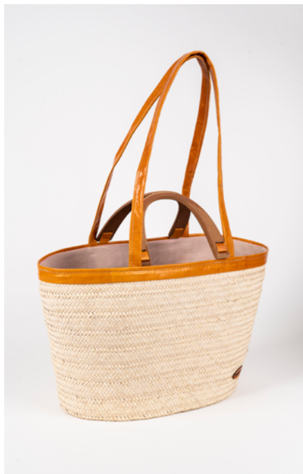
SA3 H. 30 cm L. 60 cm Sac couffin