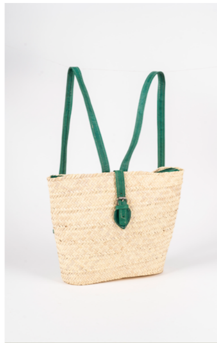
SD H. 25 cm L. 20 cm Sac à dos