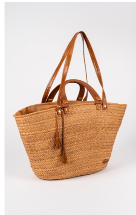
SA0 H. 30 cm L. 60 cm Sac couffin

Les sacs sont des couffins en fibres de palmier avec une touche moderne, cuir, bois... Ils sont adaptés pour tout type d'usage : shopping, sortie entre amis, pique-nique, plage.