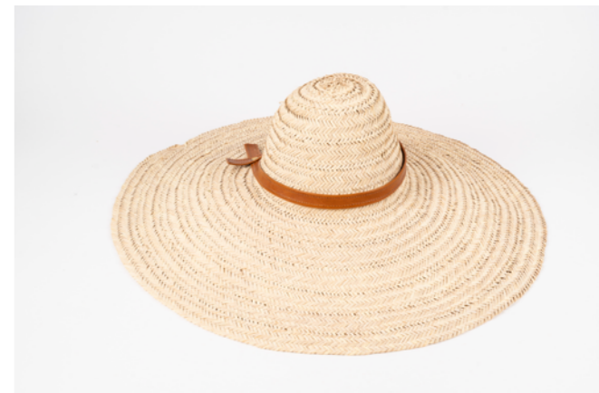
CH1 H. 10 cm L. 55 cm Chapeau